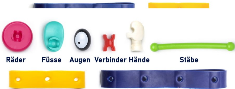
Räder Füße Augen Verbinder Hände Stäbe

Das Spielset enthält flexible Verbindungsänder mit denen sich die verschiedenen Teile zusammen mit gesammelten Gegenständen wie zum Beispiel PET-Flaschen, WC-Papier-Rollen, Kartons oder Tannenzapfen in verschiedenste neue Objekte verwandeln lassen.